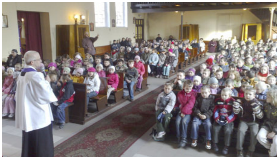
Z rekolekcji wielkopostnych