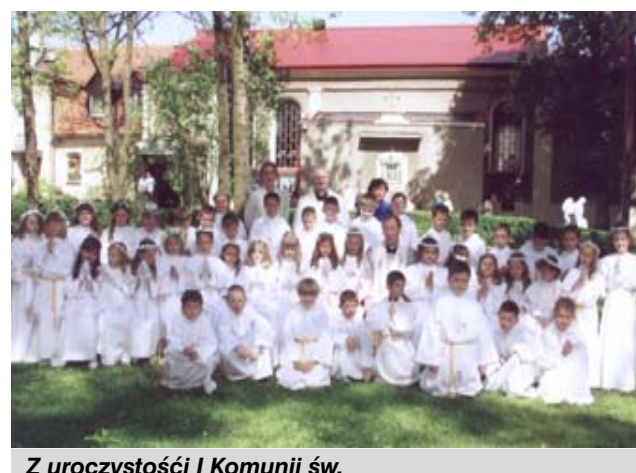
Z uroczystości I Komunii św.

● W parafii są dwie grupy dziewcząt i chłopców z Eucharystycznego Ruchu Młodych. Te dzieci uczą się, jak być rycerzem Chrystusa. W kwietniu odbyły się uroczyste promocje – przyjęcie żółtej chusty i odznak tego ruchu. ● Po odbyciu rocznego kursu, podczas wrocławskich promocji, trzech naszych ministrantów przyjęło funkcję lektora (ministranta Słowa Bożego), a dwóch lektorów zostało ceremoniarzami. ● W dniu 13 maja odbyła się uroczystość I Komunii św. 40 dzieci zostało włączonych do wspólnoty stołu eucharystycznego. Również w tym dniu dzieci z klas trzecich obchodziły pierwszą rocznicę przystąpienia do sakramentów.