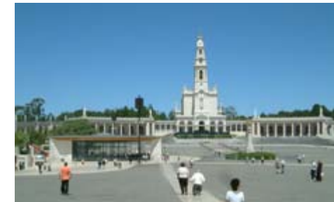
Bazylika – miejsce objawień.

Ludność Portugalii była prostym, uczciwym i pracowitym narodem, lecz pod względem materialnym ubogim. W sprawach religii, bogaci siali nienawiść i nakłaniali do prześladowań Kościoła. Rządzący spodziewali się rychłego wyeliminowania w Portugalii katolicyzmu. Dzieciom w szkołach kazano maszerować z napisami: „Ani Boga, ani religii”. I tam w Portugalii, Najświętsza Dziewica wybiera trójce skromnych pastuszków, by przekazać im swoje orędzie dla współczesnego świata. Trójka zwyczajnych dzieci, niczym nie różniących się od swych rówieśników, których jedynym obowiązkiem było pasienie trzodek należących do ich rodzin. Byli to: Łucja, najstarsza z nich (miała 10 lat), ▶ 2