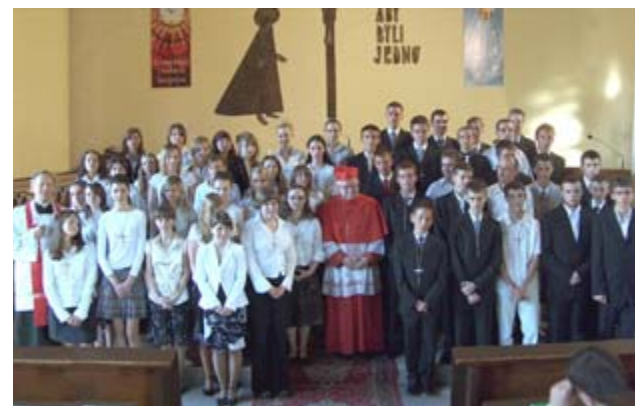
Z uroczystości bierzmowania

● Dzieci z parafialnej świetlicy i dziewczynki ze scholi wzięły udział w wiosennej wycieczce do Kotliny Kłodzkiej. ● W Niedzielę Biblijną nasza młodzież wystąpiła z pięknym koncertem i rozważaniem o Piśmie św. Natomiast nasz parafialny chór, choć niezbyt liczny, kolejny raz ubogacił śpiew w naszej świątyni swoim wielkanocnym występem. ● Pod koniec maja grupa parafian wzięła udział w pielgrzymce do Kalisza (do Sanktuarium Św. Józefa), zorganizowanej przez nasz Klub Seniora. Pielgrzymi gorąco modlili się do Świętego Opiekuna Rodzin, a po drodze do Kalisza zwiedzili zamek Czartoryskich.