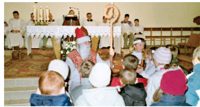
Św. Mikołaj nie zapomniany o dzieciach w naszej parafii - po mszy roratniej w świetlicy.