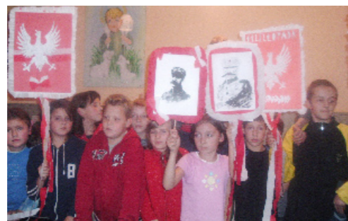
Świetlica – pon.-piątek 15:00-19:00