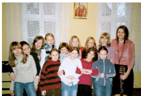
Schola dziewczęca – sobota 11:00