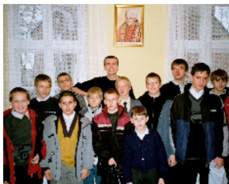
Ministranci młodszy – piątek 17:00