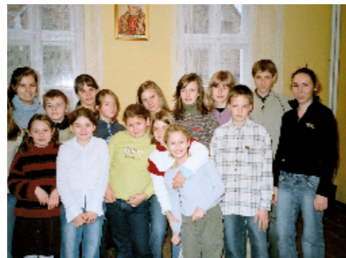
Eucharystyczny Ruch Młodych – czwartek. 13:45; piątek - 18:00