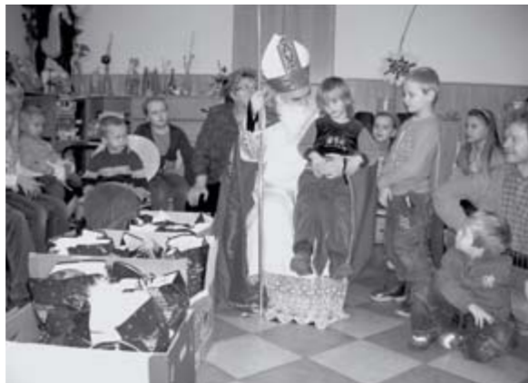
Z uroczystości św. Mikołaja w świetlicy parafialnej.

■ W Uroczystość Chrystusa Króla (w ostatnią niedzielę roku liturgicznego) odbyły się promocje do grona ministran-