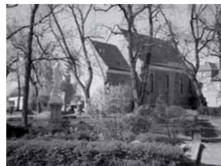
Nasza świątynia w swej okazałości.

■ 18 października Klub Seniora przy naszej parafii zorganizował pielgrzymkę „Szlakiem Cysterskim”. Trasa pielgrzymki prowadziła przez Trzebnicę, Lubiąż,