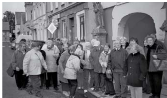
Z pielgrzymki seniorów "Szlakiem cysterskim".