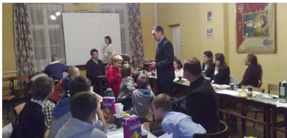
Ze spotkania scholi i ministrantów w Uroczystość Chrystusa Króla

* OFIARY zbierane na cele charytatywne w naszej parafii (w trzecią niedzielę miesiąca), wyniosły w tym roku 10.500 zł. Kwotę tę przeznaczono głównie na cele świetlicy parafialnej dla dzieci i na kolonię. Również część tych funduszy przekazano osobom, znajdującym się w trudnej sytuacji materialnej - okolicznościowe zapomogi.