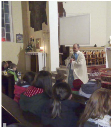
Z rekolekcji adwentowych

* REKOLEKCJE ADWENTOWE odbywały się w dniach 12-15 grudnia. Wielu z nas pobożnie w nich uczestniczyło. Niepokoi jednak fakt, że w tym roku niewiele dzieci w nich uczestniczyło. W rekolekcjach prze-