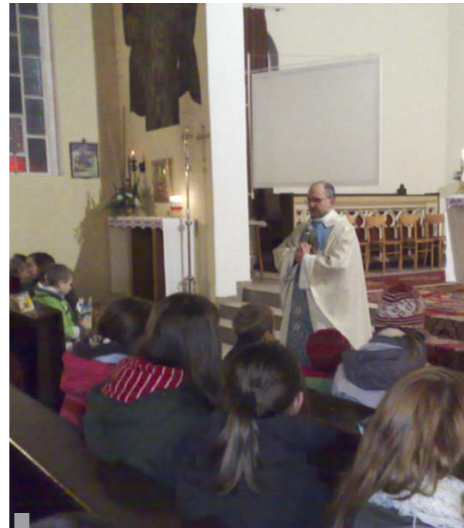
Z rekolekcji adwentowych

* REKOLEKCJE ADWENTOWE odbywały się w dniach 12-15 grudnia. Wielu z nas pobożnie w nich uczestniczyło. Niepokoi jednak fakt, że w tym roku niewiele dzieci w nich uczestniczyło. W rekolekcjach prze-