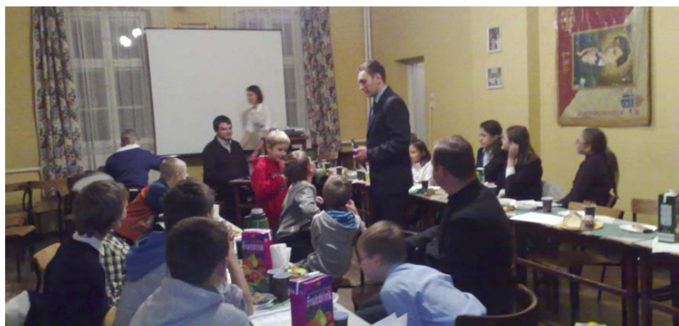
Ze spotkania scholi i ministrantów w Uroczystość Chrystusa Króla

* OFIARY zbierane na cele charytatywne w naszej parafii (w trzecią niedzielę miesiąca), wyniosły w tym roku 10.500 zł. Kwotę tę przeznaczono głównie na cele świetlicy parafialnej dla dzieci i na kolonię. Również część tych funduszy przekazano osobom, znajdującym się w trudnej sytuacji materialnej - okolicznościowe zapomogi.