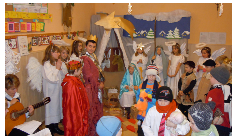
Z Wigilii dla dzieci w świetlicy parafialnej